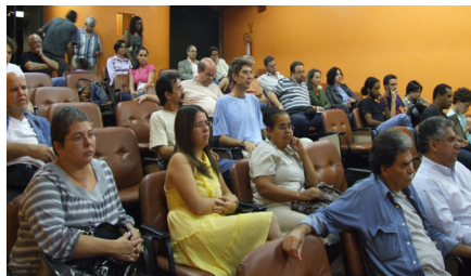
Público acompanha AG de posse da nova diretoria da ADUFU-SS