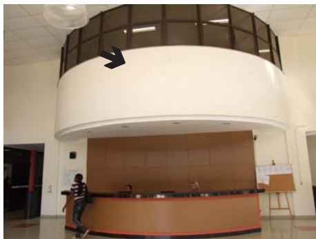
Saguão de entrada da Reitoria de onde foi retirada a foto de Costa e Silva

A ADUFU-SS, por meio de suas instâncias, tem oferecido resistência à onda de homenagens a signatários do AI-5 e agentes da ditadura militar na UFU, como fronteira de luta política contra o enquadramento da memória sobre o regime autocrático que vitimou, torturou, assassinou e fez desaparecer brasileiros e brasileiras que lutavam por liberdade e transformações sociais. Essa resistência surtiu efeito. No saguão do prédio da reitoria, no Campus Santa Mônica, o painel fotográfico de registro do suposto ato fundador da UFU foi retirado, como se pode constatar na foto acima. Superar práticas que afrontam a democracia é