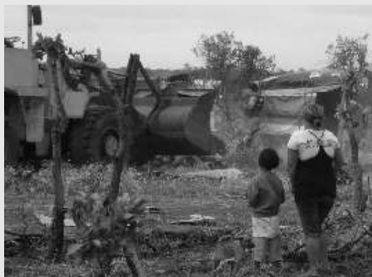
despejo de famílias da ocupação em Uberlândia

Em agosto de 2011 cerca de 3000 famílias em Uberlândia foram despejadas de uma ocupação próxima ao CEASA. A decisão do despejo baseou-se em documentos com indícios concretos de fraudes cartorárias. Hoje a área vai destinar-se a ser um novo cemitério.